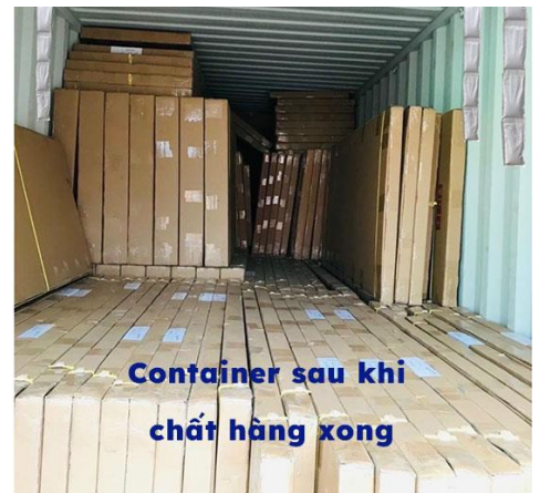
Container sau khi chất hàng xong