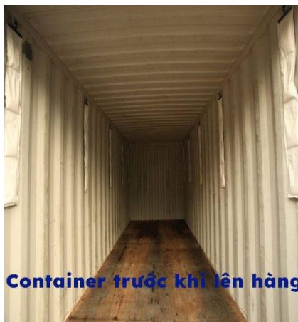
Container trước khi lên hàng