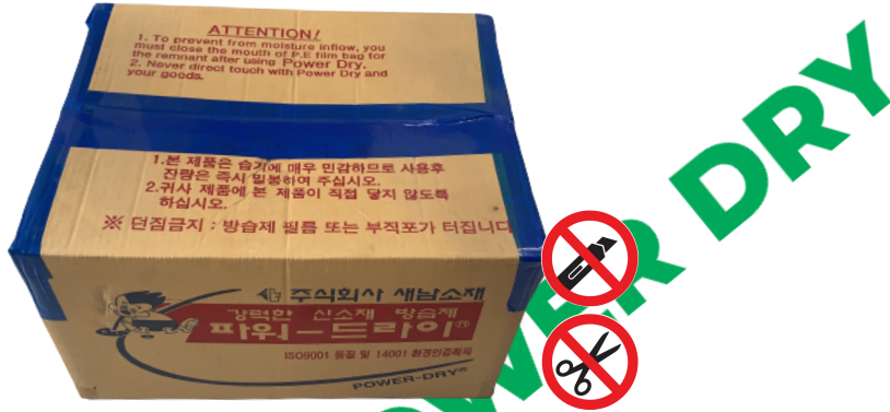
Không dùng dao, kéo, vật sắc nhọn để mở thùng hàng

Lưu ý: Khi bạn mở thùng hút ẩm để lấy các gói hút ẩm ra sử dụng, tuyệt đối không được dùng dao, kéo hoặc vật sắc nhọn để mở, vì nó dễ bị cắt quá sâu vào thùng gây rách các gói hút ẩm bên trong thùng.